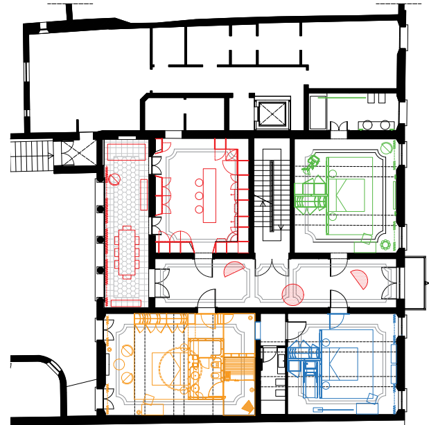
Grundriss mit Verteilung der einzelnen Suiten

Der Entwurf von Giovanni Mecozzi Architeti schafft eine positive Beziehung zur historischen Residenz, die durch einen kontinuierlichen Dialog zwischen architektonischer Erinnerung und zeitgenössischer Vision entstanden ist, wobei jedes Detail zur Stärkung der Identität des Ortes beiträgt. ●